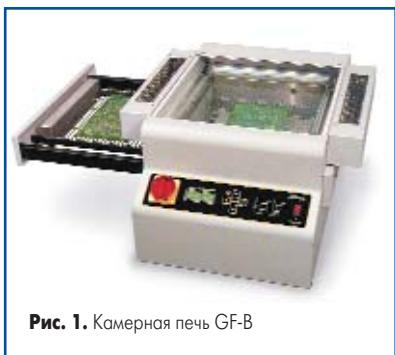
Рис. 1. Камерная печь GF-B

Работы по разработке печей для оплавления припоя фирма APS проводит совместно с американской фирмой NOVASTAR, и в последнее время ими разработаны новые модели с улучшенными параметрами, охватывающие большой диапазон оборудования — от простейших камерных до многозонных конвейерных печей. Мощные конвейерные печи с числом зон нагрева от 4 до 12 выпускаются фирмой NOVASTAR.