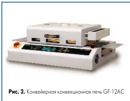
Рис. 2. Конвейерная конвекционная печь GF-12AC