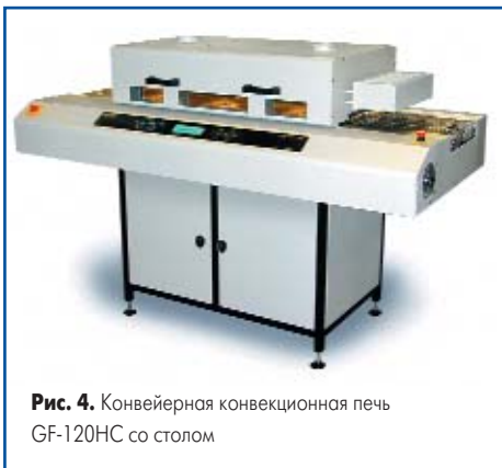
Рис. 4. Конвейерная конвекционная печь GF-120HC со столом

мерный прогрев всех компонентов платы и идеальную передачу тепла. Дополнительный регулируемый вентилятор на выходе печи позволяет быстро охлаждать печатные платы. Конвейерная система с регулировкой скорости обеспечивает плавное перемещение односторонних и двусторонних печатных плат.