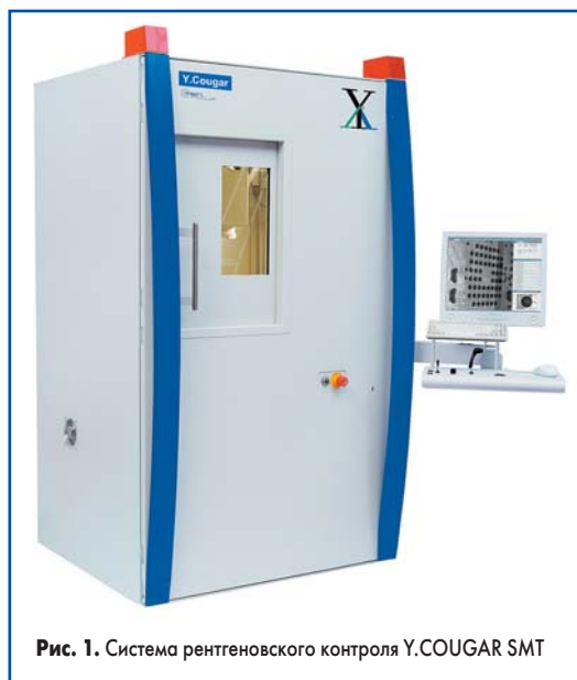
Рис. 1. Система рентгеновского контроля Y.COUGAR SMT

Компания YXLON International GmbH (ранее — YXLON International Feinfocus GmbH) — мировой лидер в производстве рентгеновских систем контроля с высоким разрешением, применяемых не только в электронной отрасли, но и в других отраслях про-