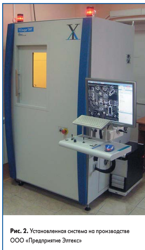
Рис. 2. Установленная система на производстве ООО «Предприятие Электес»

При выборе системы рентгеновского контроля критичными для нас были массо-габаритные показатели, так как место установки находится на третьем этаже производственного помещения, при этом затруднен подъезд и есть ограничения по площади. Поэтому важным аргументом в пользу выбора этой системы стал ее вес — 1450 кг и занимаемая ею площадь — около 1 м 2 . Кроме того, доступ для технического обслуживания установки имеется только с передней стороны. Эти особенности позволили нам оптимально разместить установку: в углу производственного цеха (рис. 2). Рассматриваемые нами системы других производителей не только занимали большую площадь, но и имели двери для техобслуживания с двух сторон, что, в свою очередь, приводило к увеличению рабочей зоны вокруг установки.