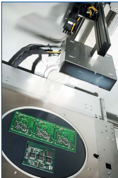
Рис. 3. Поворотный стол и плоский цифровой детектор

Использование данной трубки в совокупности с плоским цифровым детектором высокой контрастности позволяет получать отличное качество изображения инспектируемого образца в режиме реального времени. Поворотный стол и возможность наклона детектора до 70° в обе стороны дает возможность проводить всестороннюю проверку и анализ изделия (рис. 3).