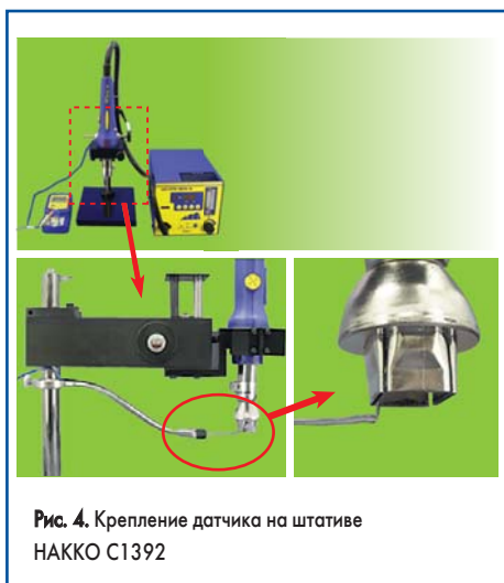
Рис. 4. Крепление датчика на штативе НАККО С1392

крепляется или на корпусе термовоздушной станции (рис. 3), или на штативе (рис. 4).