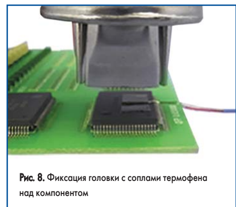
Рис. 8. Фиксация головки с соплами термофена над компонентом

и фиксируется на нем (рис. 8). Температура горячего воздуха варьируется в зависимости от расстояния между головкой и компонентом, окружающей среды, температуры помещения и т. д. Режим работы следует устанавливать с учетом реальных условий окружающей среды, например наличия кондиционера.