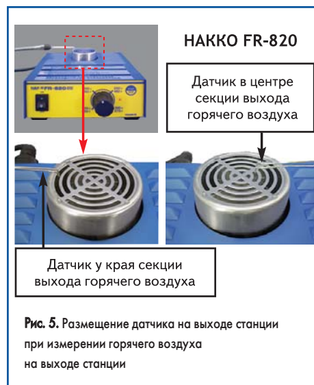
Рис. 5. Размещение датчика на выходе станции при измерении горячего воздуха на выходе станции

При измерении горячего воздуха на выходе станции предварительного разогрева (термовоздушная станция НАККО FR-820) датчик поочередно помещается в центр секции выхода горячего воздуха и к ее краю (рис. 5), его необходимо также размещать на расстоянии 1–2 мм от выхода.