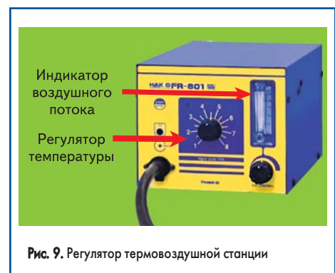
Рис. 9. Регулятор термовоздушной станции

С помощью регуляторов термовоздушной станции (температура и поток) устанавливаются тепловой режим, соответствующий безопасной для компонента температуре, но позволяющий быстро и качественно произвести пайку (рис. 9).