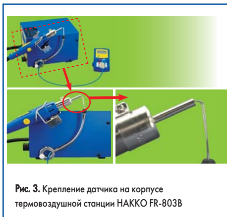
Рис. 3. Крепление датчика на корпусе термовоздушной станции НАККО FR-803В

Датчик при измерении горячего воздуха у сопла головки (термометр FG-100 и термовоздушная станция НАККО FR-803В), в зависимости от применяемого оборудования, за-