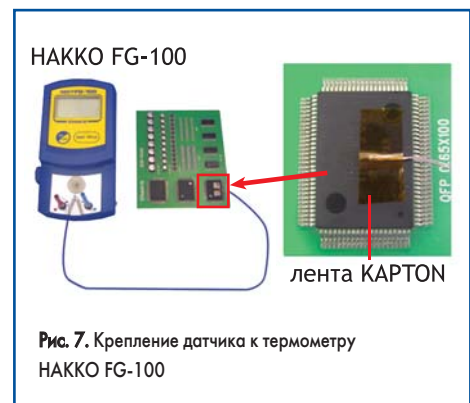
Рис. 7. Крепление датчика к термометру НАККО FG-100

На термофене станции НАККО FR-801 устанавливается головка с соплами, соответствующими применяемому компоненту,