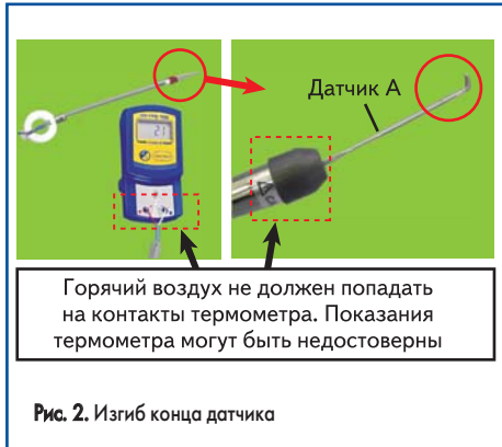
Рис. 2. Изгиб конца датчика

1. Необходимо изогнуть конец датчика, как показано на рис. 2.