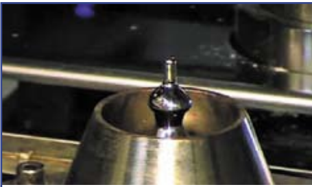
Рис. 1. Усовершенствованные насадки с диаметром отверстия 1,5 мм

поп в них. Это опять же связано с небольшим объемом припоя, протекающего через насадку. Когда припой вытекает через небольшое отверстие, то он стекает вниз по смоченной поверхности. Из-за поверхностного натяжения на насадке поток припоя постепенно замедляется, что в итоге приводит к увеличению высоты припоя на ней. Но с ростом давления поток припоя все-таки «упадет» с кончика насадки, и высота волны резко уменьшится. Все это происходит достаточно быстро и приводит к нестабильности высоты волны. Часто это явление ошибочно называют неточностью работы насоса или неточностью его разрешающей способности, но на самом деле причина кроется в насадке.