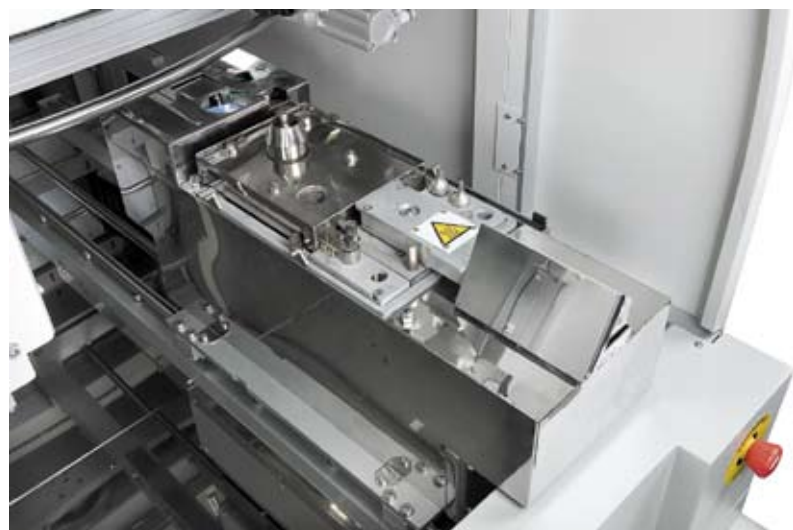
Рис. 5. Ванна припоя с банком сменных насадок

Pillarhouse нацелена на развитие технологии селективной пайки. Компания постоянно выводит на рынок передовые решения и намерена продолжать работать в этом направлении: дорабатывать, развивать и внедрять новые технологии в процесс селективной пайки.