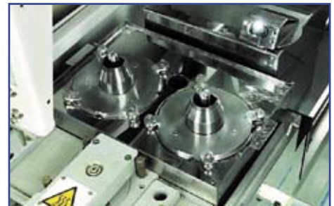
Рис. 4. Ванна с двумя универсальными насадками AP-1

Еще одно новшество — это маркировка ванны и катушки с припоем. Из-за увеличения количества бессвинцовых и других припоев на производстве становится обязательным контролировать загрузку в машину правильного сплава. Маркировка припоя позволяет идентифицировать определенный сплав для ванны и пометать его. После этого машина будет распознавать тип припоя, загруженного в ванну. Затем в программе ванна закрепляется за изделием, чтобы пайка не началась, если в машину загружен другой припой. Кроме того, помечается и катушка с припоем, загруженная в питатель, чтобы припой в ней соответствовал припою в ванной.