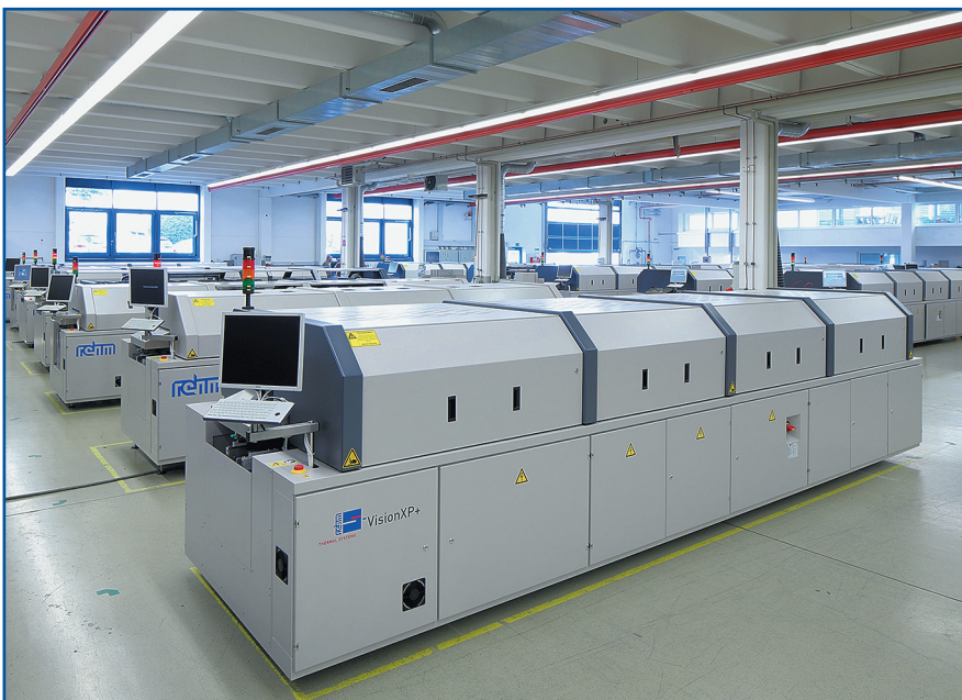
Рис. 1. Установки VisionXP+ в производственном цехе

Diehl Controls успешно применяет технику пиролиза, разработанную Rehm. «Мы зафиксировали зна-